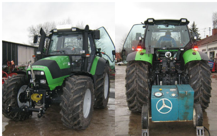
Leistungs-Messgerät rechts an der Zapfwelle

Unsere Kunden beklagen, dass die neuen Schlepper, die mit Deutz-Common-Rail-Motoren (DCR-Technik) ausgestattet sind, im unteren Drehbereich zu träge wären und zu langsam auf Touren kommen. Diesem Nachteil versuchen wir entgegen zu steuern. Aus diesem Grunde testeten wir das Dipol-Dieseltuning-Verfahren mit einem neuen Deutz AGROTHRON M 620 am Leistungsprüfgerät. Das Ergebnis brachte die gewünschte Verbesserung der Beschleunigung in allen Leistungsstufen.